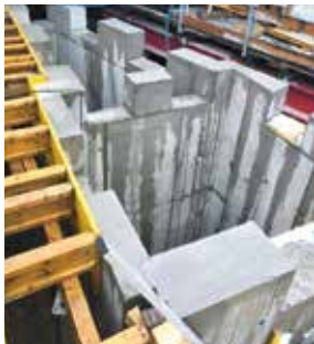
Die Verzahnungen (Schubknaggen).

Zusätzlich zur Erdbebensicherheit werden mit dieser Konstruktion die akustischen Anforderungen an das Gebäude gelöst. Durch die Nähe der Eisenbahnlinie und die gut befahrene Strasse werden Vibrationen erzeugt. Diese Schwingungen gelangen in das Gebäude und können zu leichten Erschütterungen führen. Dies war ein weiterer Grund, weshalb alle Verzahnungen mit einem speziellen Gummilager, welche eine maximale Belastung von 500 t/m 2 aufnehmen, zu entkoppeln. Die Schubknaggen erfordern eine sehr genaue Ausführung. Die Verlegeflächen müssen total glatt sein, die maximale Unebenheit beträgt nur einen Millimeter.