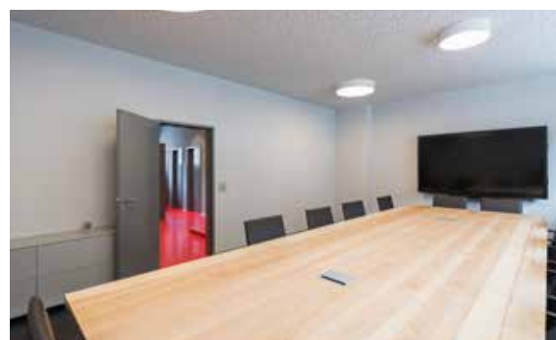
Das grosse Sitzungszimmer mit dem massgeschreinerten Tisch unserer Schreinerei.