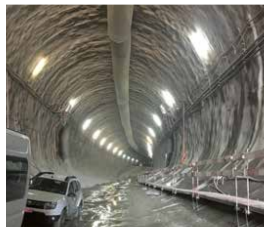
Die dritte Gubrist-Röhre in Arbeit.

Danach wird die erste, alte Röhre geschlossen und saniert. Nachdem dann auch die zweite Röhre wieder auf Vordermann gebracht worden ist, sollte ab dem Jahr 2025 der Gubrist baustellen- und staufrei befahren werden können. So das Ziel.