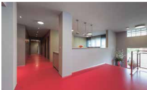
Der Empfangsbereich mit dem roten Industrieboden aus verschiedenen Blickwinkeln.

Unser grösster Büro-Standort in der Hächler-Gruppe ist an der Tägerhardstrasse 118 in Wettingen. Hier sind vier Firmen präsent: Hächler AG Bauunternehmen, Hächler-Reutlinger AG, Hächler AG Immobilien sowie die Hans Hächler Verwaltungs AG. Seit Kurzem erstrahlt unser Empfangsbereich in neuem Glanz.