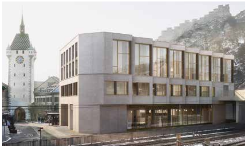
So wird der Neubau aussehen: Eine Visualisierung.