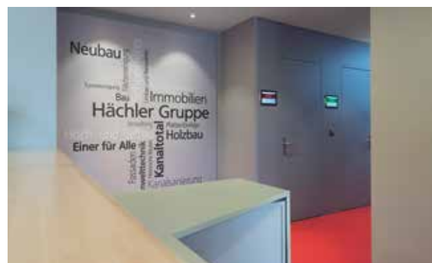
Blick auf zwei Sitzungszimmereingänge mit modernem Reservationssystem.